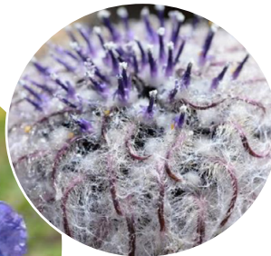
サウスレア・メデューサ