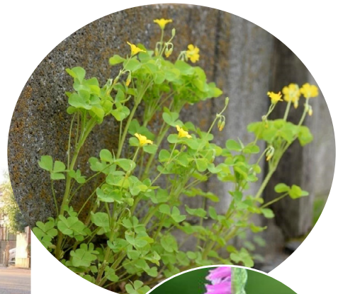
オッタチカタバミ