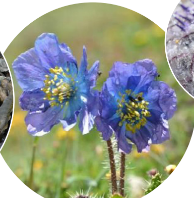
メコノプシス・ホリドゥウラ